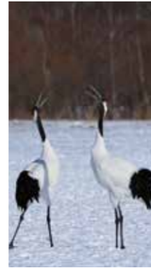
愛の鳴き交わり [鶴居村/2017年1月] 中澤 美津子(札幌市厚別区) 一生添い続けるタンチョウのつがい。声高々に鳴き交わります。