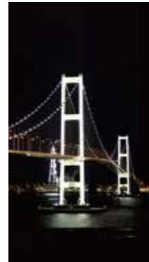
夜の白鳥大橋 [室蘭市/2017年11月] 能登 喬也(札幌市厚別区) 室蘭市にある白鳥大橋のライトアップです。工場の夜景とマッチしていて、とてもきれいな夜景です。