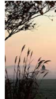
晩秋の朝 [黒松内町/2017年10月] 水上 柳子(黒松内町) 寒い朝、静かに霧が流れる。大好きな風景です。