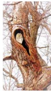
森の番人(エゾフクロウ) [札幌市/2017年12月] 千田 一也(札幌市南区) エゾフクロウが札幌の街に飛来してくる事は、珍しいそうです。