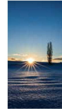
冬の夕景 [美瑛町/2017年3月] 釜澤 まつみ(札幌市白石区) 山の向こうに沈む夕日が、ポプラの木と雪面を照らし、次々と変わりゆく風景に感動しながらシャッターを切りました。