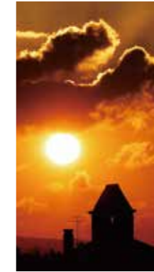
朝のドラマ [黒松内町/2016年9月] 下村 俊之(黒松内町) 秋の朝陽は美しく、強烈な印象でした。