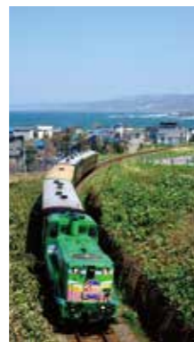
海を望む路 [留萌市/2016年5月] 平 正男(札幌市西区) 留萌から増毛へ続いていた鉄路は、海の見えるのどかな場所がたくさんあります。