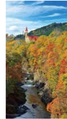
メルヘンワールド [滝上町/2017年10月] 永井 和子(旭川市) 秋晴れで錦秋のタイミングと、種やかな滝が感動です。天空の雲も程よく、赤い屋根がメルヘンの世界でした。