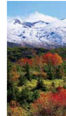
雪化粧 [美瑛町 十勝岳望岳台/2017年10月] 原田 芳昭(札幌市西区) 紅葉と雪化粧をした十勝岳が印象的でした。