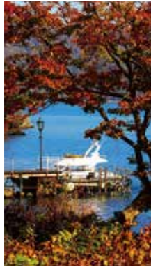
晩秋の支笏湖 [千歳市 支笏湖/2017年10月] 大口 芳子(札幌市厚別区) 紅葉の奥にある船着き場も、心なしか淋げに見えました。