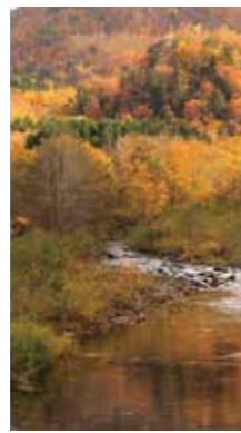
晩秋 [赤井川村/2016年10月] 真田 美代子(倶知安町) 紅葉の終わる頃、川も染まり綺麗でした。