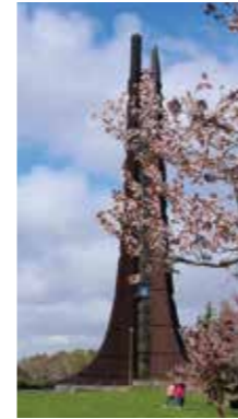
百十50年目の春 [札幌市/2017年5月] いとう しんじ(札幌市厚別区) 松浦武四郎が1869年に「北海道」と命名して150年。様々な記念行事が計画されている。