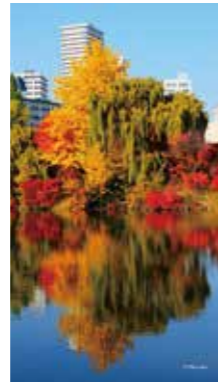
リフレクションズ reflections [札幌市 中島公園/2017年10月] 日野 透(札幌市中央区) 桜の頃、夏の木々が青い頃、そしてこの紅葉の季節も、中島公園はいつでも美しい。