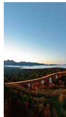
三国峠の夜明け [上士幌町 三国峠/2017年10月] 芳賀 茂俊(恵庭市) 紅葉する峠と松見大橋。遠くに見える雲海が、実に良い光景だ。