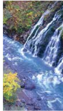
白ひげの滝 [美瑛町/2017年9月] 中村 幸子(札幌市清田区) 紅葉の始まりと滝を写してみました。