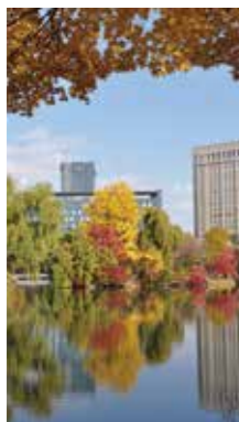
華やく水面 [札幌市 中島公園/2017年10月] 細川 哲男(札幌市豊平区) 紅葉が水に写り、その美しさが追ってくるようでした。