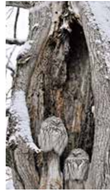
眠りにつく時 [苫小牧市 北大研究林/2018年2月] 芳賀 茂俊(恵庭市) やっとエゾアフロウのつがいに会えた。古木に出来た穴の中で身を寄せ合っている。お昼寝の時間がな～まったり。