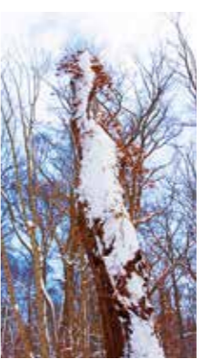
天に向かって [野幌原山林/2018年1月] 大口 雄一(札幌市厚別区) ツルアジサイは、ドライになってても原山林に彩りを添えていました。