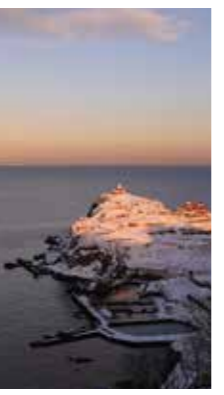
Sunset Lighthouse [小樽市/2018年2月] 杉本 真也(札幌市手稲区) 黄昏時。今日も一日が終わろうとしている。