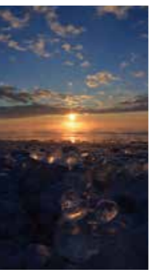
ジュエリーアイスの朝 [豊頃町 大津海岸/2016年1月] 真田 美代子(倶知安町) ジュエリーアイスの広がる大津海岸に日が出て、ジュエリーが輝きました。