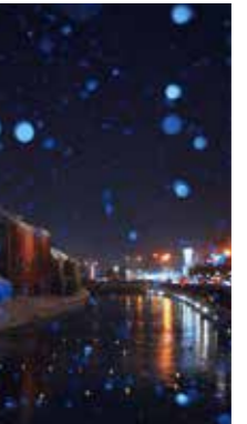
雪の小樽運河 [小樽市/2018年2月] 原田 芳昭(札幌市西区) 雪の降る小樽運河は幻想的で感動しました。