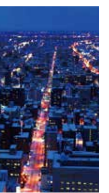
冬の灯り道 [札幌市/2018年2月] 大口 是るみ(札幌市厚別区) 灯りに照らされた何処までも続く道の先には…。