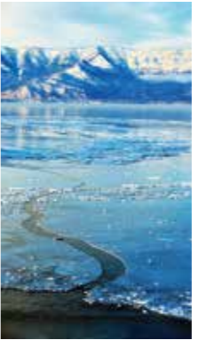
屈斜路湖砂場も凍る湖畔 [弟子屈町/2018年1月] 芳賀 茂俊(恵庭市) 砂場はいつも白鳥たちが羽根を休めるポイントだ。今朝は猛烈に冷え込んだのか、薄氷が張っている。