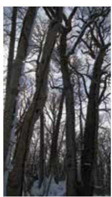
冬に耐える [江別市/2018年1月] 大口 雄一(札幌市厚別区) 厳冬の季節、林立する樹木が凍える冷気に耐えながら、ひたすら春を待っているようでした。