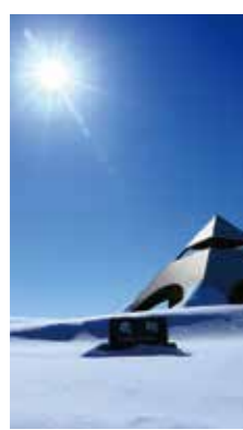
北西の丘雪景 [美瑛町/2017年3月] 近藤 成美(江別市) 冬に見ることのできない風景が広がっていました。