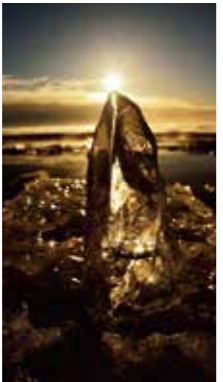
アイスキャンドル [豊頃町 大津海岸/2018年1月] 坂口 正剛(江別市) 大津海岸の浜に打ち上げられた川氷の先端に朝日が重なり、まるで金色のろうソクに火が灯った感じに見えました。