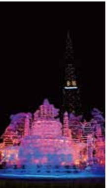
北海道生誕150周年パースデー [札幌市/2018年2月] 船山 晃宏(札幌市手稲区) 北海道と命名されて150周年を祝った雪まつり会場の氷像がかわいらしかった。