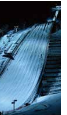
蒼いジャンツェ [札幌市 大倉山ジャンプ競技場/2018年1月] 日野 透(札幌市中央区) 雪中撮影のため、寒風の空気を伝えるべく、WBを作為的に操作して青色を強調してみました。