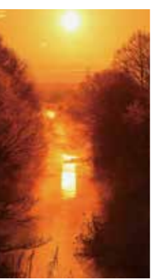
金色に輝く川面 [千歳市/2018年1月] 宮下 征治(札幌市中央区) 氷点下18℃の川面は川霧もあり、美しく輝いていました。