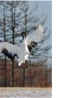
うーい! [鶴居村 伊藤サンクチュアリ/2018年1月] 平 正男(札幌市西区) 寒ければ寒いほど元気になる姿を見ていると、こちらも寒さを忘れてしまいます。