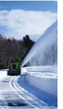
春への始動 [斜里町/2018年3月] 狩野 隆(札幌市豊平区) 冬季間通行止の知床横断道路開通に向け、除雪作業が始まった。