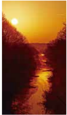
燃える朝 [千歳市 祝梅川/2018年1月] 芳賀 茂俊(恵庭市) 氷点下15℃の朝。小川は真っ赤に燃える朝になる。