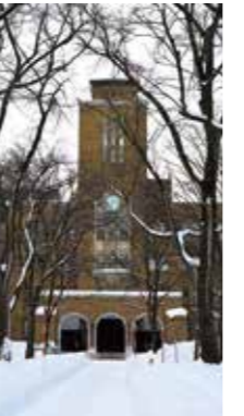
冬の農学部本館 [札幌市 北海道大学/2018年1月] 佐藤 昌弘(札幌市厚別区) 北海道大学の農学部本館は、時計塔がそびえる4階建ての建物です。