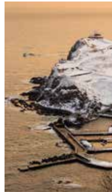
朝焼けの岬 [小樽市/2017年2月] 坂口 哲裕(石狩市) 朝陽に染まる岬が綺麗でした。