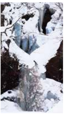
氷瀑 [札幌市/2018年2月] 早瀬 正(札幌市手稲区) 寒さが厳しいこの時期しか見ることができない「自然が造った氷像」です。