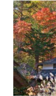
秋うらら [札幌市 紅松公園 / 2016年10月] 鈴木 章勝 (札幌市北区) 葉の赤や黄色、スキの白、松の緑と古い民家が魅力的な景観です。