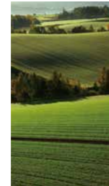
縞模様 [美瑛町 / 2018年10月] 原田 芳昭 (札幌市西区) 朝日に照らされて、緑色の縞模様が輝いていました。