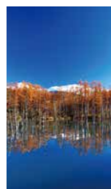
青い池初冬 [美瑛町 / 2018年11月] 遠藤 司 (札幌市白石区) 曇一つ無い青空、遠くに冠雪の大雪連峰を魅せながら、水面に空の青を映し出していた。自身の碧より空の青さを覆ってくれました。