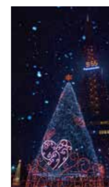
雪のイルミネーション [札幌市 大通公園 / 2018年11月] 美紗 (札幌市豊平区) 雪が舞う日を持っていました。