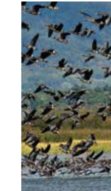
飛翔 [美瑛町 / 2018年10月] 長友 逸郎 (札幌市手稲区) マガンが何かに驚いて飛び立った。私も音でびっくり。シャッターを押した。