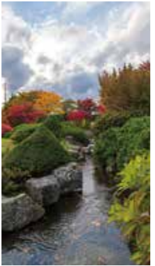
秋色の庭園 [札幌市 / 2018年10月] 坂口 正剛 (江別市) 奥に紅葉を従え、流れに紅葉の浮かぶ様子は、秋のものに感動します。