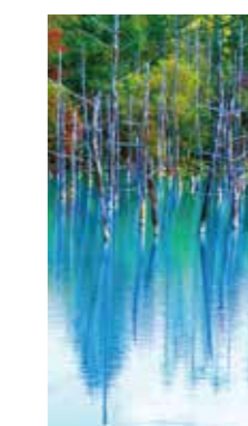
神秘的池 [美瑛町 青い池 / 2018年10月] 大口 はるみ (札幌市厚別区) 青い水と立ち枯れた木々の並ぶ幻想的な景観に魅了されました。