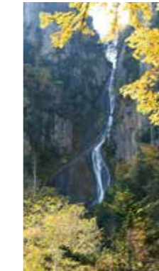
秋のおとずれ [上川町 / 2014年10月] 長友 逸郎 (札幌市手稲区) 紅葉が上から下へと降りてきた層雲峡の紅葉はスケールが違います。