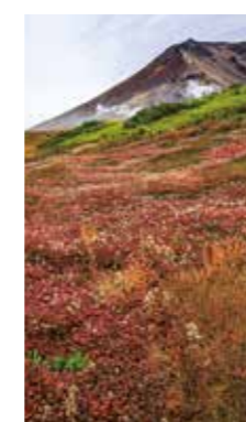
晩秋の旭岳 [東川町 旭岳 / 2018年10月] 釜澤 まつみ (札幌市白石区) チングルマの葉が紅に色づいた草紅葉と、ハイマツ帯の緑と、噴煙の白が、旭岳の晩秋の風景です。