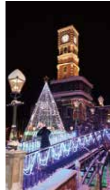
白い恋人パーク [札幌市 / 2018年12月] 富田 光枝 (札幌市中央区) 白い恋人パークは一年を通して楽しめる中庭が魅力です。特に冬はイルミネーションがきれいですね。