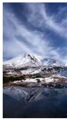
旭岳映る [東川町 旭岳 / 2018年10月] 狩野 隆 (札幌市豊平区) 鏡池の水面に映る初冬の旭岳の姿は種やかだった。