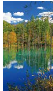
対の青 [美瑛町 / 2018年10月] 大口 雄一 (札幌市厚別区) 高く高く澄んだ、秋の空を映した静かな水面は、紺碧の色を湛え、気持ちを和ませてくれました。