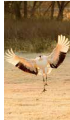
ランディング landing! [鶴居村 / 2017年12月] 鶴居村 哲裕 (石狩市) 朝焼けの中、飛んできたタンチョウ。着地する瞬間が綺麗でシャッターを切りました。