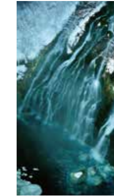
初冬の白ひげの滝 [美瑛町 白金 / 2018年11月] 芳賀 茂俊 (恵庭市) ライトアップされた白ひげの滝。何時より少しおとなし目のライトアップだ。でも、これ位が丁度良い。