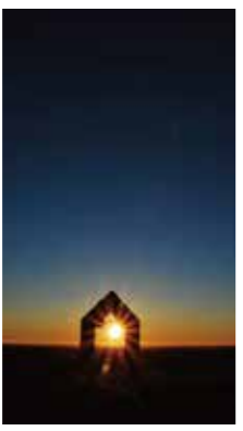
グッドモーニング [中標津町 開陽台 / 2018年11月] 松井 繁男 (中標津町) 開陽台にある俵の鐘の中に太陽が重なった瞬間に撮った1枚です。