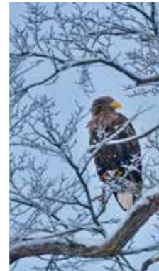
寒さに耐えて [名寄市 / 2017年12月] 桑原 弘光 (名寄市) 毎年冬になると天塩川河畔に立つ巨木にオジロワシのつがいがやって来てくれます。極寒の中、臍や体に氷が付着しても、連れをジッと待つ姿に感動させられました。