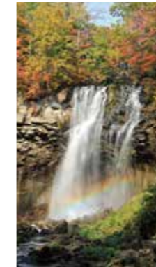
虹 [札幌市 滝野 / 2016年10月] 中澤 孝志 (札幌市厚別区) 滝にかかる虹が見たくて出掛けました。紅葉と虹と、美しいシーンでした。