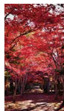
紅葉のトンネル [札幌市 平岡樹芸センター / 2018年11月] 宮下 征治 (札幌市中央区) 息を飲む美しさでした!!