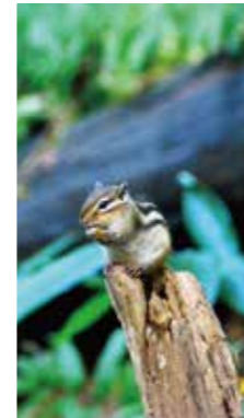
なんとなく食欲の秋 [札幌市 円山公園 / 2018年10月] 佐藤 昌弘 (札幌市厚別区) 公園内に散歩している、エゾリスが何かを食べていました。きっと冬眠前の腹こしらえでしょうか？