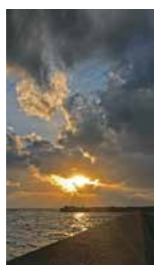
防波堤の夕景 [伊達市 黄金漁港 / 2018年11月] oshimugi (伊達市) とても穏やかな日で、夕日が暖かく感じました。