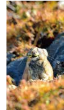
冬仕度 [美瑛町 望岳台 / 2017年10月] 平 正男 (札幌市西区) せっせと食料を運ぶナキウサギ。くわえた葉っぱがヒゲみたいですよ。笑うヒゲウサギ。