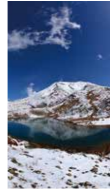
初冬の旭岳 [札幌市 旭岳 / 2017年10月] 穴戸 里よ子 (札幌市北区) 遅い初雪を迎えた次の日の朝。霧が晴れてすっきりとしたお山が姿を見せてくれました。