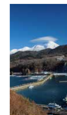
冬迫る ウト口港 [斜里町 / 2018年12月] 村上 秀夫 (斜里町) 秋鮭も終わり静まり返るウト口港。知床の山並みは早くも冬の装い。