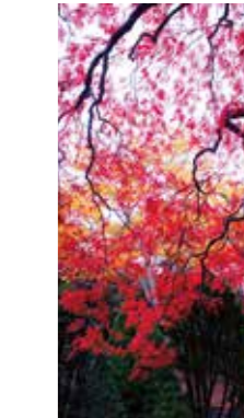
レッド ファンタジー Red Fantasy [札幌市 平岡樹芸センター / 2018年10月] 日野 透 (札幌市中央区) この燃えるような赤色が何とも素晴らしい。この世のものとは思えない。正に、Red Fantasy (赤い幻想) です。