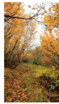
浅黄 [倶知安町 イワオヌプリ / 2014年10月] 杉本 真也 (札幌市手稲区) ニセコ連峰縦走中、この日は非常に風が強かったのですが、山間はとても穏やかで心地良く黄葉のアーチを歩きました。