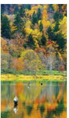
錦秋をV満喫 [士別市 ボン天塩湖 / 2017年10月] 永井 和子 (旭川市) お天気も良く、釣り人が遠くに見えました。紅葉と釣りのコラボ感がとても良く、思わず手を振ると大きく振り返って下さり、楽しそうなお様子でした。